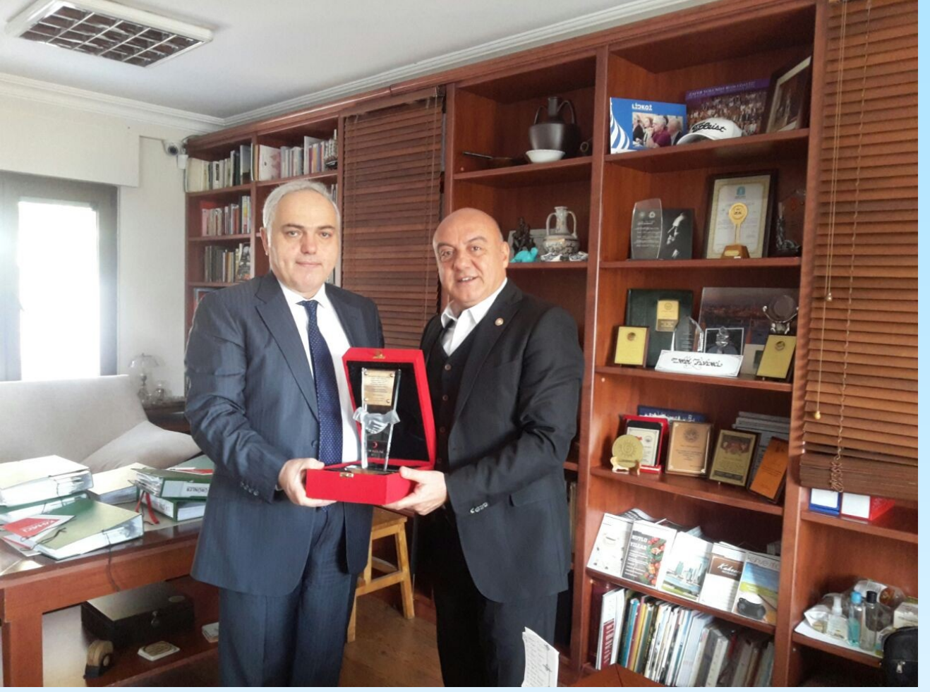
Kızılay ile Bir Çalışma