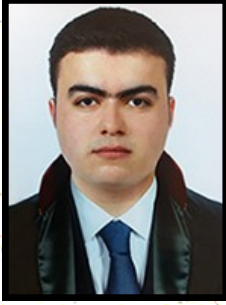
Av. Baha TEPEBAŞI