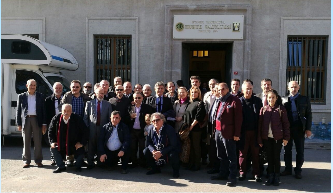
40 Yıl Sonra Sınıf Ziyareti