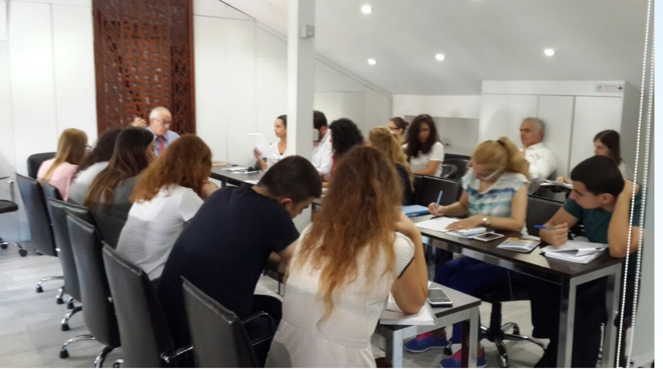
Büromuzda Eğitim Çalışması