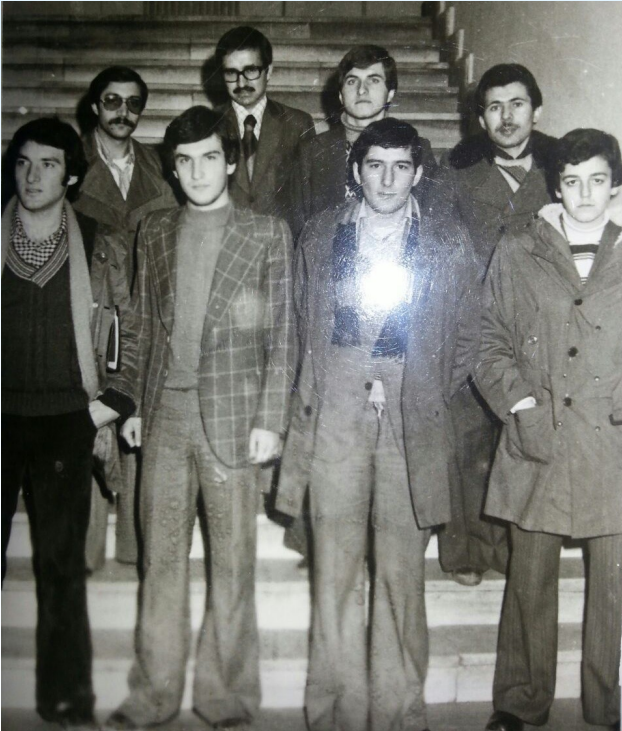
Nostalji: 1978 İ.Ü. Hukuk Fakültesi