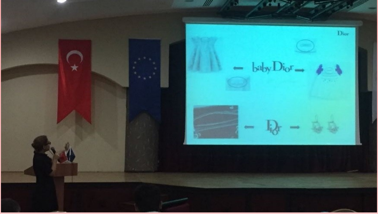
23 Ekim 2016 - Antalya - Av. Gülşan ÜLGEN