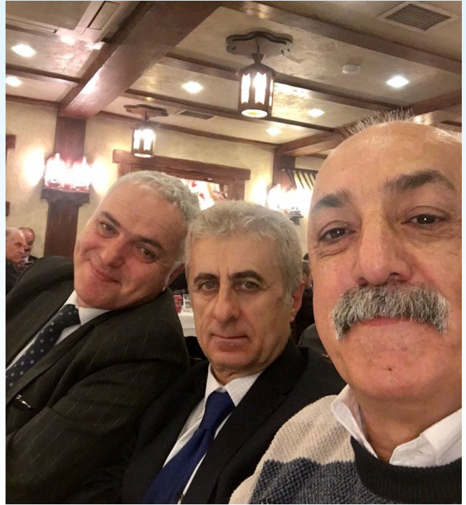
40 Yıl Sonra Üniversite